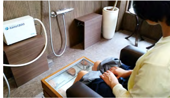
▲高濃度炭酸泉足浴

血行の悪さは様々な病気を引き起こす原因となるため、血流改善作用のある炭酸泉治療は、未病（疾病の発症予防）にも非常に有意義だといわれています。また、肌の保存率が向上するため皮膚疾患への効果が期待されます。