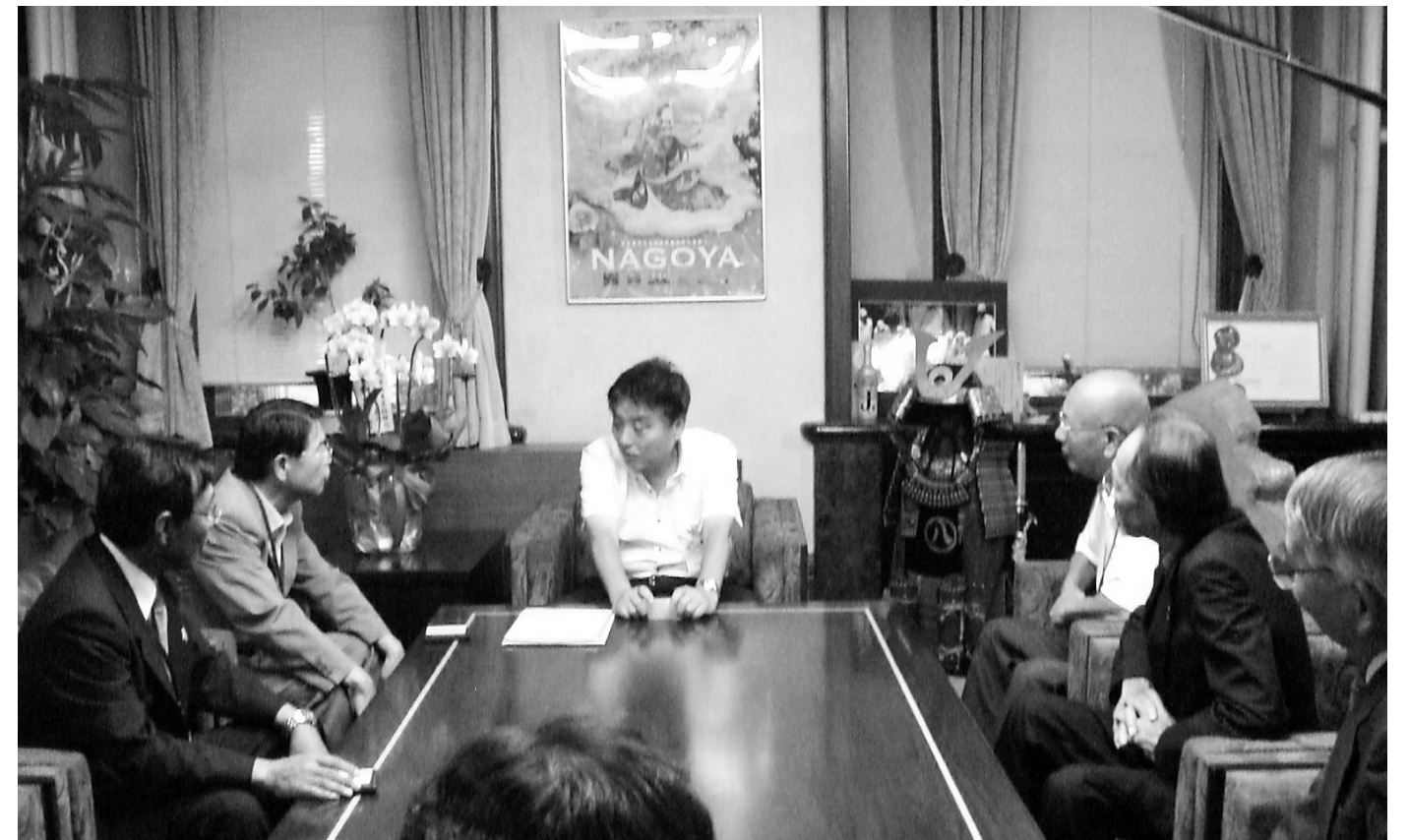
河村名古屋市長と懇談する市腎友会役員

平成21年6月16日(火)市長室で、市腎友会のメンバー11名と河村たかし市長と懇談した。市腎友会活動の一環として、要望事項7項目のうち名古屋市行政が独自に助成しているタクシーチケットを重点要望事項として現状を説明し、タクシーチケット36枚の増加を要望した。また、名古屋市各区の地域協議会のメンバーに内部障害者のメンバーを選出してほしいと要望した。市長はタクシーチケットについては皆さんの声を行政に伝える。